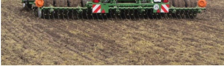
Billede 7. Pløjefri etablering.