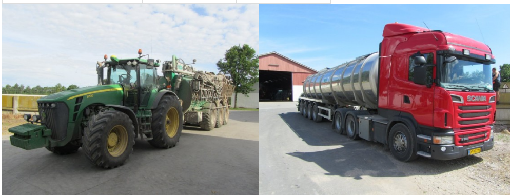
Billede 5 og 6. Transport med lastbil bruger mere end 5 gange mindre brændstof end transport med traktor. Moderne gearkasser af Vario-typen minimerer dog dette væsentligt.