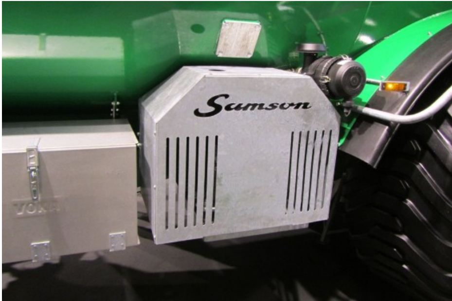
Billede 4. Kompressoren - Det viste system kan regulere lufttrykket fra 1 til 2,7 bar på ca. 3 minutter.